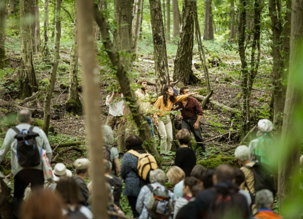
Que ma Joie Demeure, spectacle de Clara Hedouin : @ Quentin Chevrier