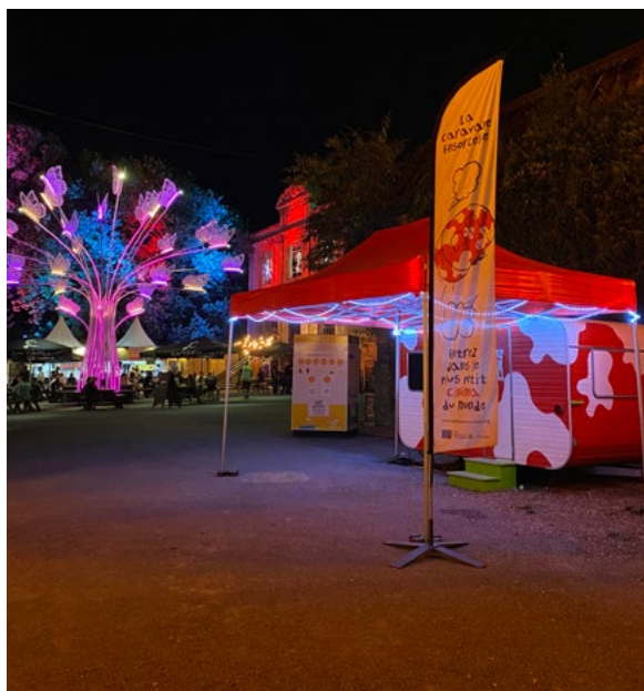
La Caravane ensorcelée

ventdesforets.com/ ; surlesentierdeslauzes.fr/ ; lepartagedeseaux.fr/ ; helicoop.fr/